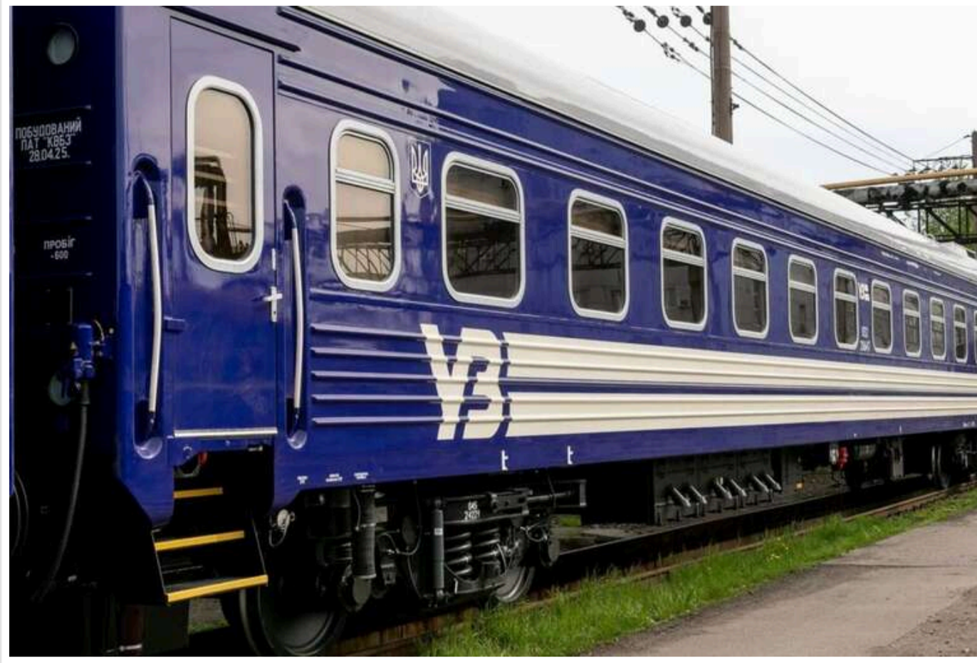
«Укрзалізниця» запускає новий швидкий рейс між Дніпром та Харковом

"Укрзалізниця" 17 червня оголосила про відкриття продажу квитків на новий регіональний рейс, який з'єднає Дніпро та Харків за лічені години. Новий графік дозволить пасажирам здійснювати поїздки туди й назад протягом одного дня.