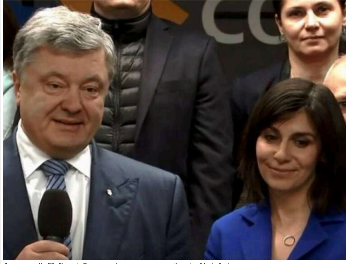
Депутатка від «ЄС» Вікторія Пташник задекларувала маєток у Козині за 26 мільйонів гривень

Читати на руськом Read in English Додати як бажане джерело в Google