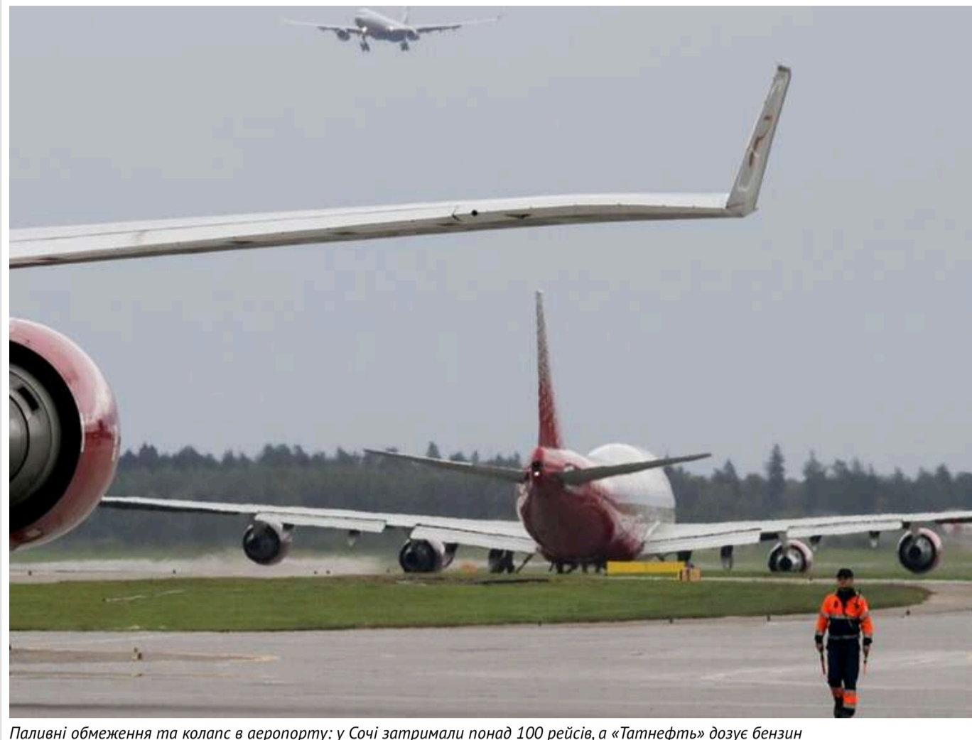
Паливні обмеження та колапс в аеропорту: у Сочі затримали понад 100 рейсів, а «Татнефть» дозує бензин

Російська «Татнефть» скасувала раніше запроваджені обмеження на продаж бензину АІ-92 та дизельного пального на своїх автозаправках.