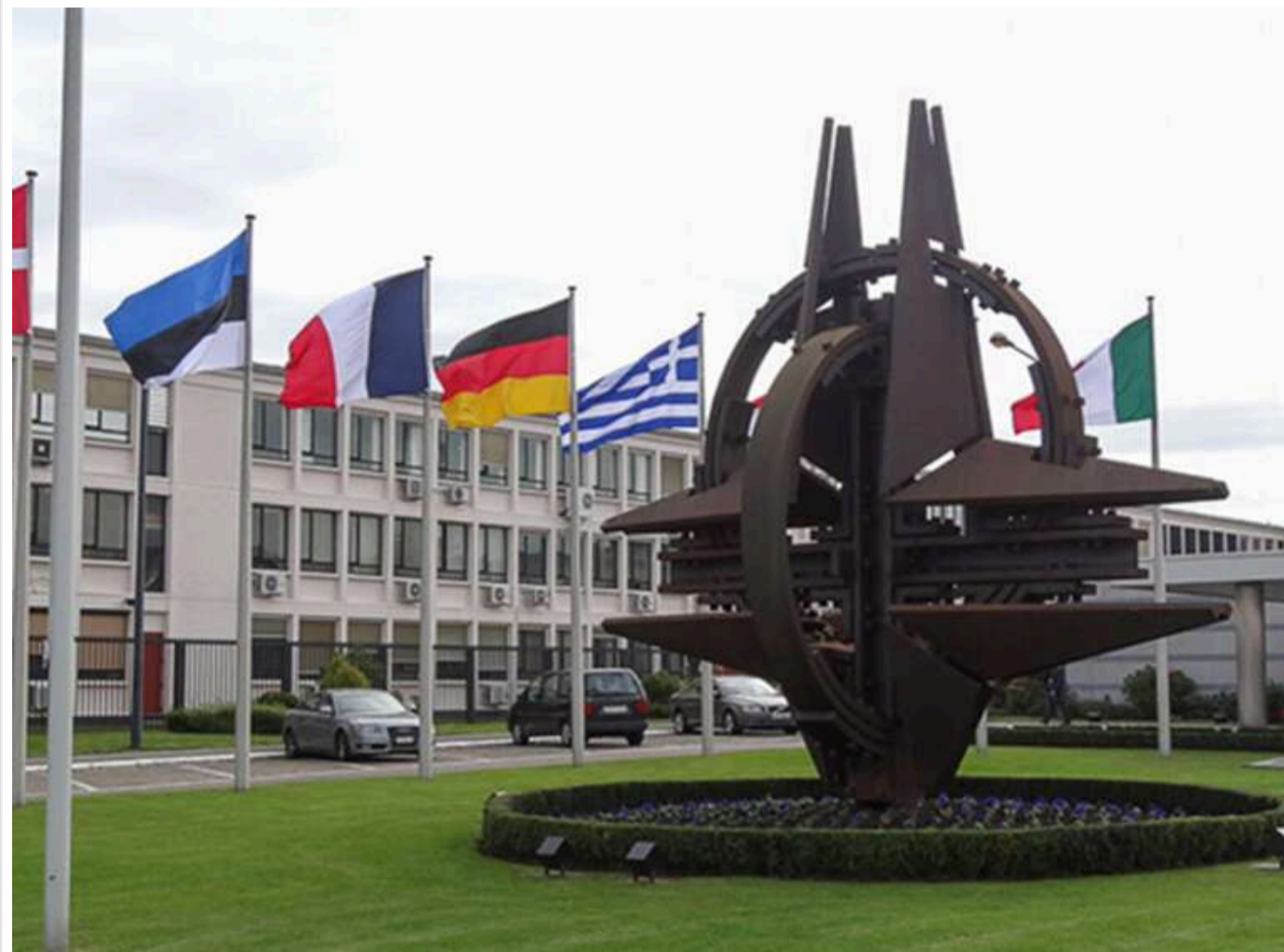
У Брюсселі відбудеться зустріч міністрів оборони НАТО під головуванням Марка Рютте

18 червня в штаб-квартирі НАТО в Брюсселі відбудеться чергова зустріч міністрів оборони країн Альянсу.