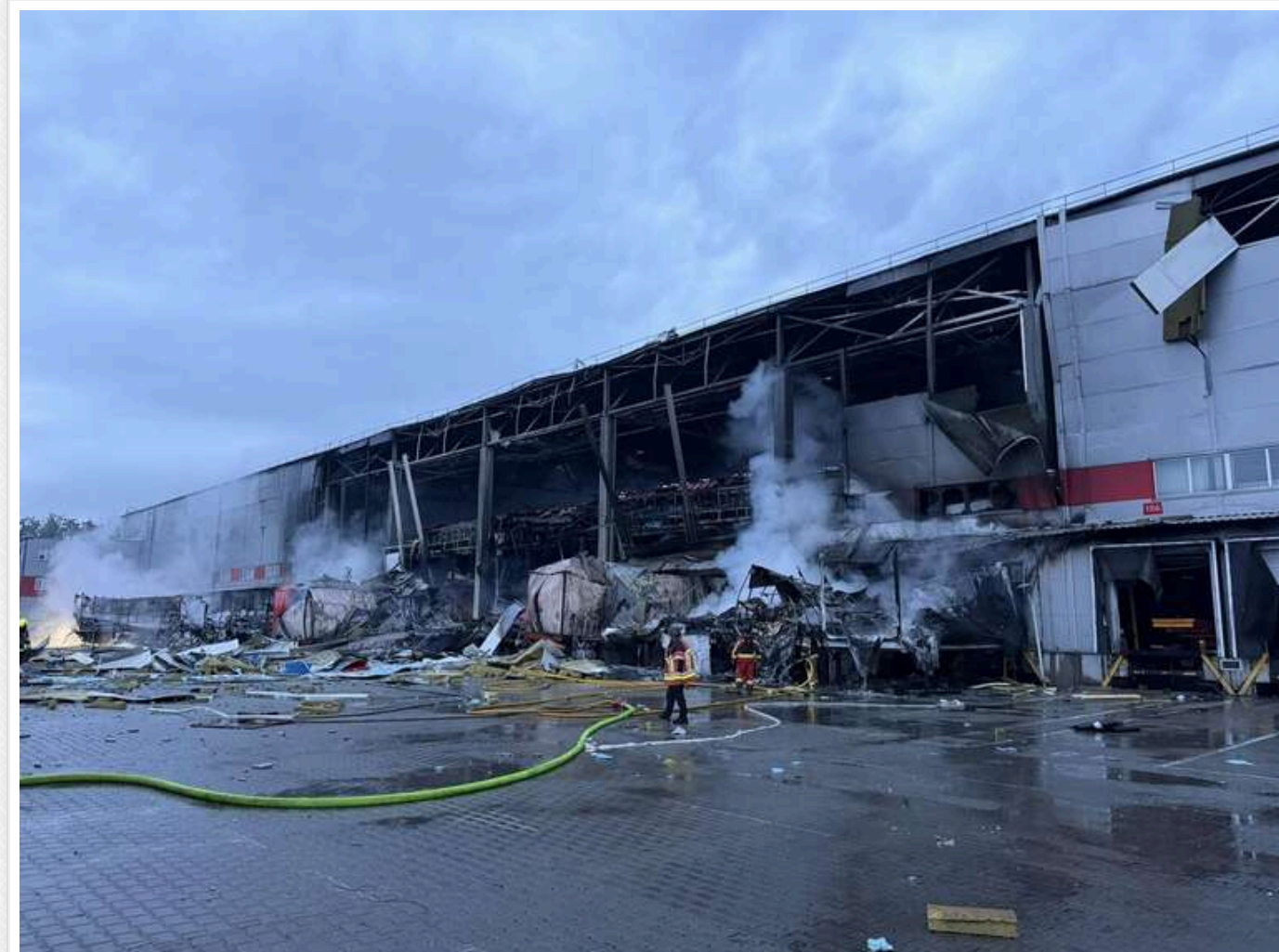
«Нова пошта» планує відновити роботу зруйнованого київського терміналу вже цього тижня

Нова пошта планує найближчими днями відновити роботу свого ключового інноваційного терміналу в Києві. Об'єкт зазнав руйнувань унаслідок ракетного удару РФ у ніч проти 15 червня. Логістичні потоки вже перевели на резервні маршрути, тому доставка відправлень не припинялася.