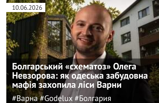
Болгарський «схематоз» Олега Невзорова: як одеська забудовна мафія захопила ліси Варни #Варна #Godelux #Болгария