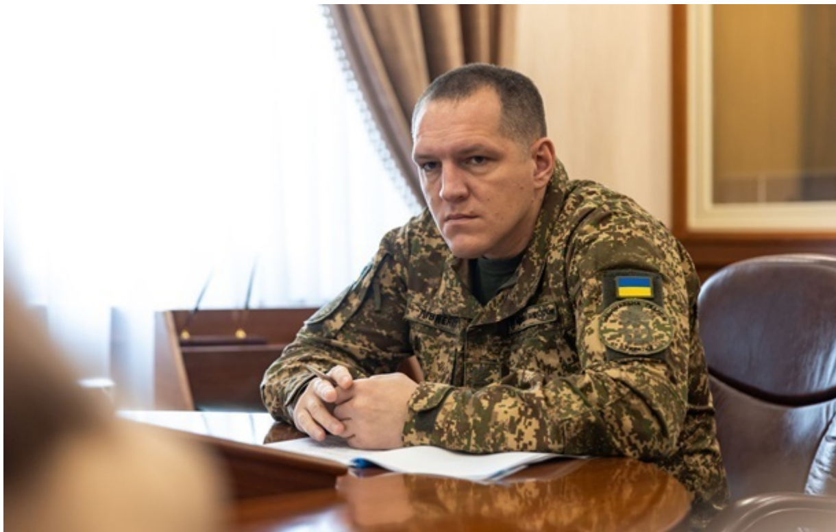
Командувач Національної гвардії України Олександр Півненко

Із кількох тисяч бійців, які самовільно залишили частину, кожен другий повернувся у стрій, констатував командувач Нацгвардії.