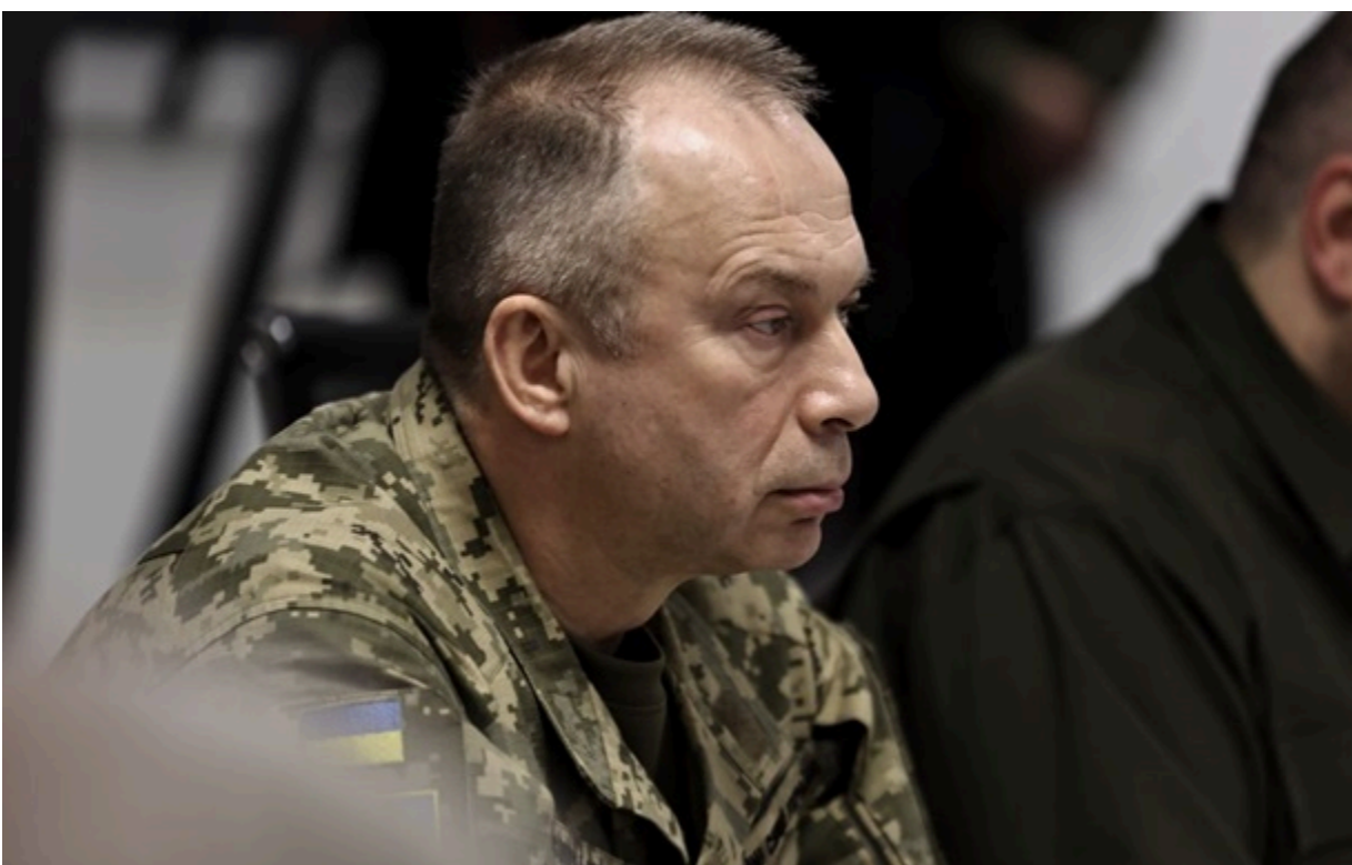
Головнокомандувач ЗСУ Олександр Сирський

Сторони наголосили на важливості підтримання постійного діалогу та координації дій для своєчасного реагування на загрози в Чорноморському регіоні.