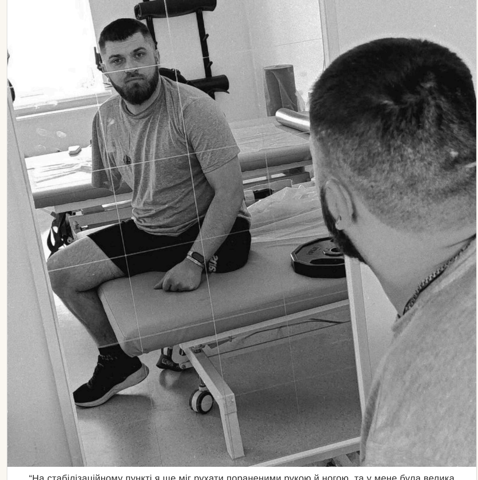
"На стабілізаційному пункті я ще міг рухати пораненими рукою й ногою, та у мене була велика втрата крові і лікарі рятували нірки, тож руку та ногу ампутували", - пояснив військовий

«Перша думка, що я живий. І я радів від цього. Без руки, без ноги, але ж живий! До речі, колись у дитинстві, як і більшість дітей, я мріяв стати Термінатором. Ось моя мрія і здійснилася», — сміється боєць.