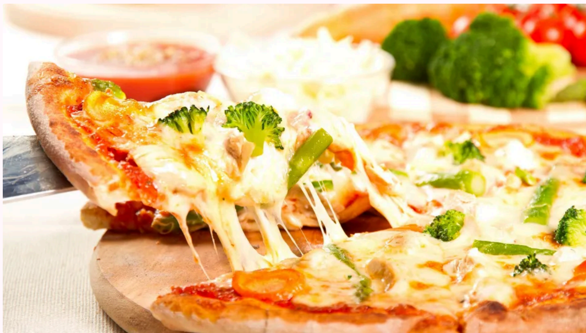
Кількість інгредієнтів може бути довільною

Український кулінар кolumбійського походження Ектор Хіменес-Браво в Instagram поділився рецептом сніданку з лаваш та яєць.