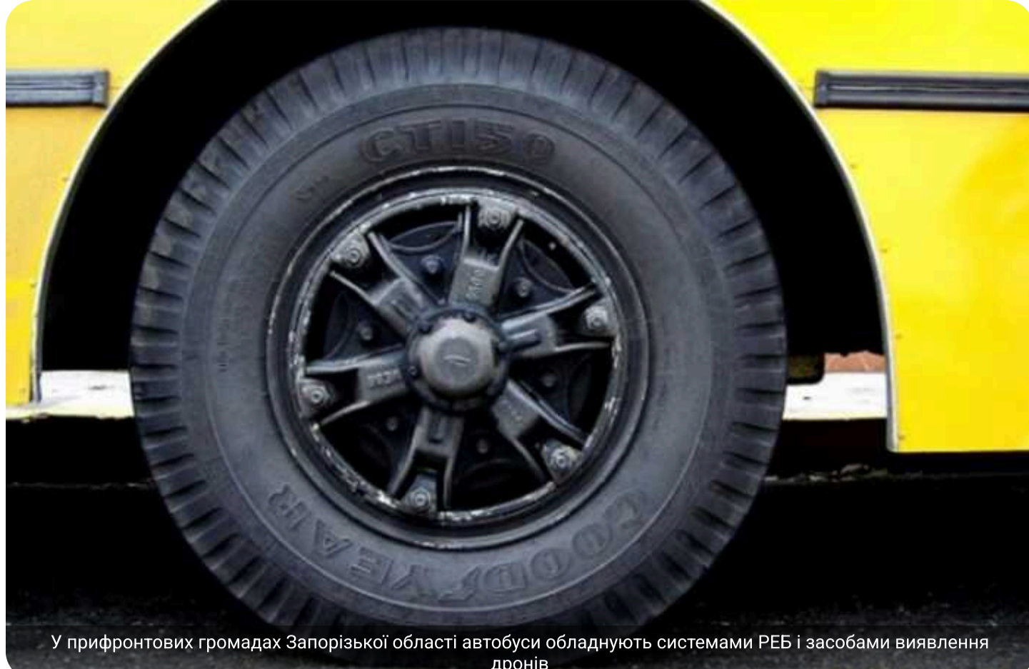
У прифронтових громадах Запорізької області автобуси обладнують системами РЕБ і засобами виявлення дронів

У прифронтових громадах Запорізької області автобуси оснащують засобами РЕБ і детекторами дронів.