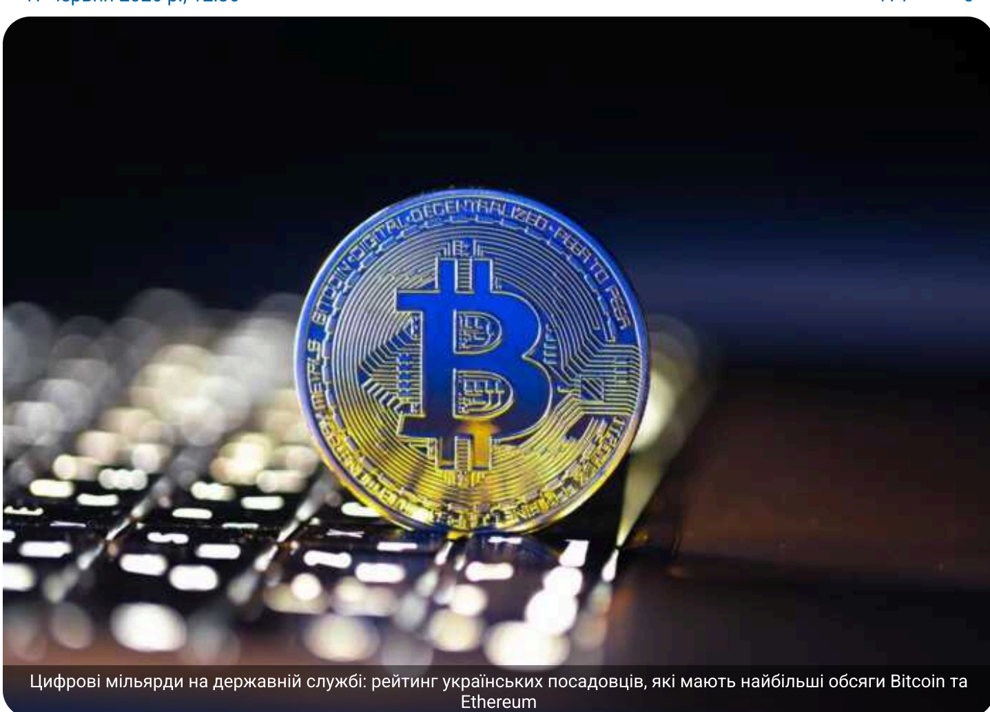
Цифрові мільярди на державній службі: рейтинг українських посадовців, які мають найбільші обсяги Bitcoin та Ethereum

В Україні продовжує стрімко зростати інтерес чиновників до цифрових активів. За рік кількість декларацій держслужбовців із внесеною криптовалютою зросла на шосту частину, а найбільше трендових активів – зокрема біткоїнів і «ефіру» – належить хмельницькому депутату Олександру Кізарю.