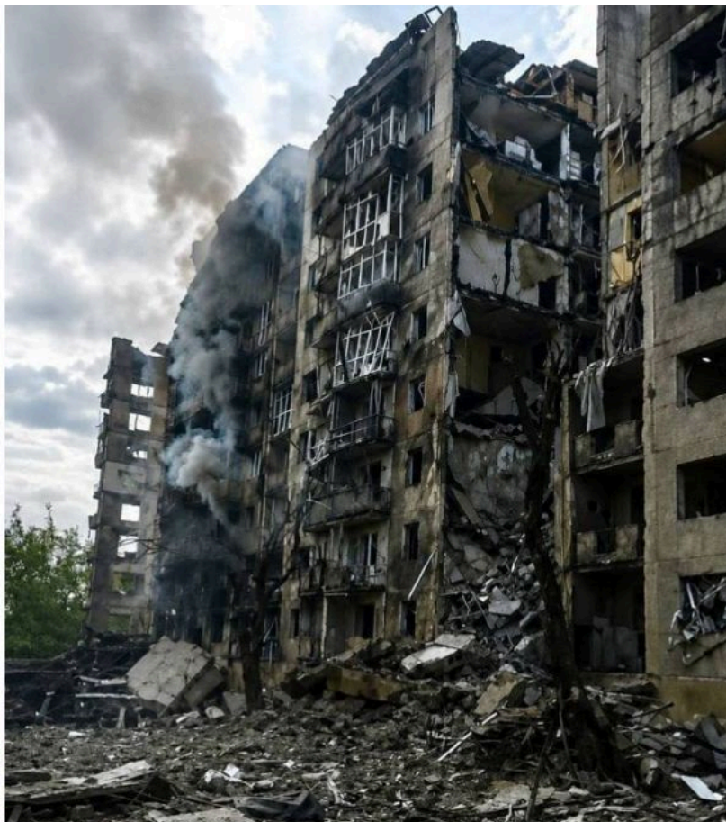
Deep State - ворог рветься до Добропілля

Російські окупанти планомірно тиснуть на Добропільський відтинок фронту , намагаючись закріпитися на підступах до міста і відрізати його логістику. Головний удар зосереджений на ділянці Родинське - Білицьке, де противник нарощує контроль і просочується вглиб оборони. Сили оборони докладають максимальних зусиль, аби зупинити ці плани, однак окрім піхоти, потужною загрозою залишаються ворожі дрони різних типів.