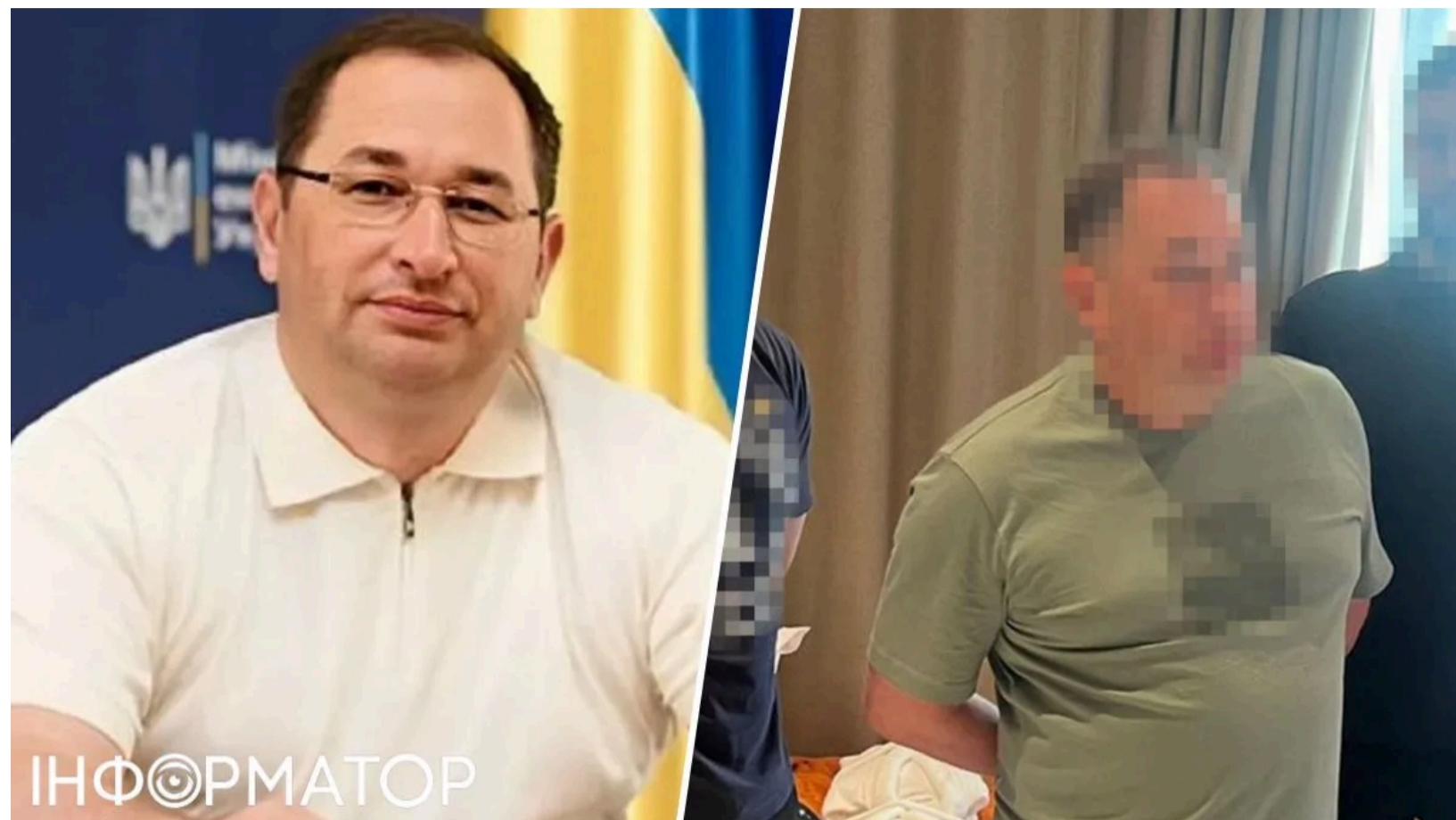
САП конфіскує майно ексзаступника Галуценка

Прокурор Спеціалізованої антикорупційної прокуратури подав позов про визнання необґрунтованими активів Олександра Хейла - колишнього заступника міністра енергетики часів Германа Галуценка. Ідеться про житловий будинок і земельну ділянку на Київщині загальною вартістю близько 5 млн грн. Майно оформлене на третіх осіб, однак придбане за дорученням самого Хейла. Аналіз його доходів показав, що набути це майно законним шляхом він не міг.