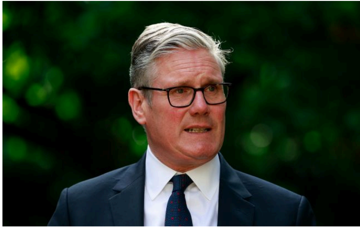
Фото: Кір Стармер (Getty Images)