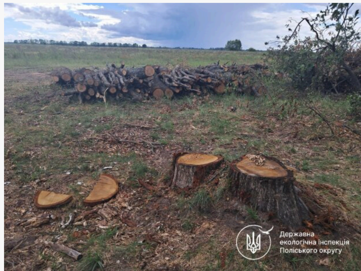
незаконна вирубка лісу

Буковинські ліси знову опинилися під прицілом безжальних шукачів легкої наживи.