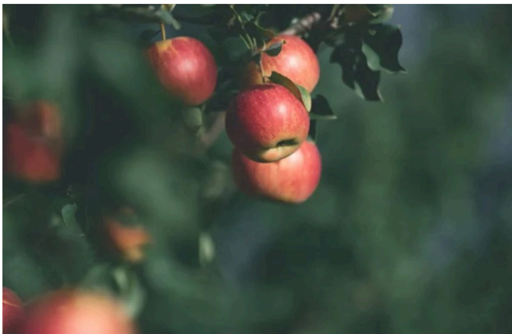
Держава інвестує понад 215 млн грн у нові сади й теплиці

З початку 2026 року Міністерство економіки, довіклля та сільського господарства ухвалило 42 рішення про надання грантів на розвиток садівництва та тепличного господарства загальною сумою 215,4 млн грн.