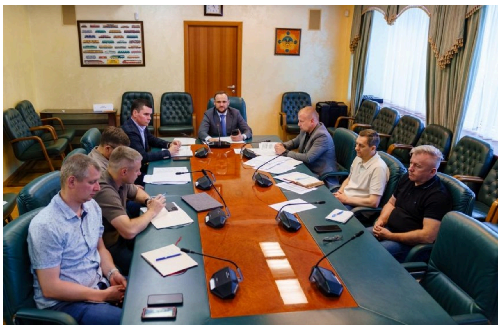
Кулеба провів перше засідання Штабу з підготовки до опалювального сезону 2026/27 / Урядовий портал

17 червня відбулося перше засідання штабу з підготовки житлово-комунального господарства та паливно-енергетичного комплексу до опалювального сезону 2026/27 року. Цей період стане п'ятим опалювальним сезоном в умовах повномасштабного вторгнення. По всій країні до роботи підготовлено вже понад 2 590 котелень та майже 3 000 км тепломереж.