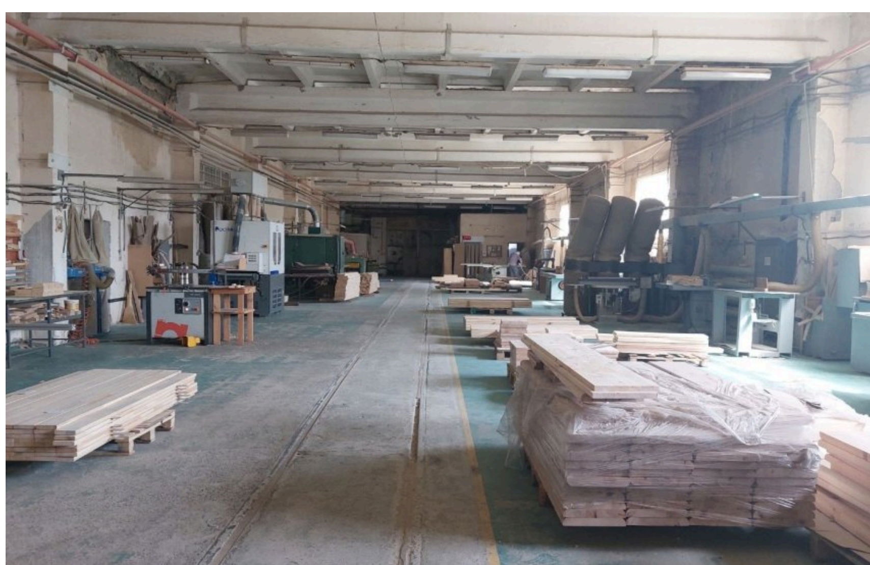
У Шептицькому виставили на продаж велике деревообробне підприємство

У місті Шептицький Львівської області виставили на продаж 100% частки діючого деревообробного та меблевого бізнесу. Власники оцінили підприємство, що працює під власною торговою маркою, у 1,25 мільйона доларів.