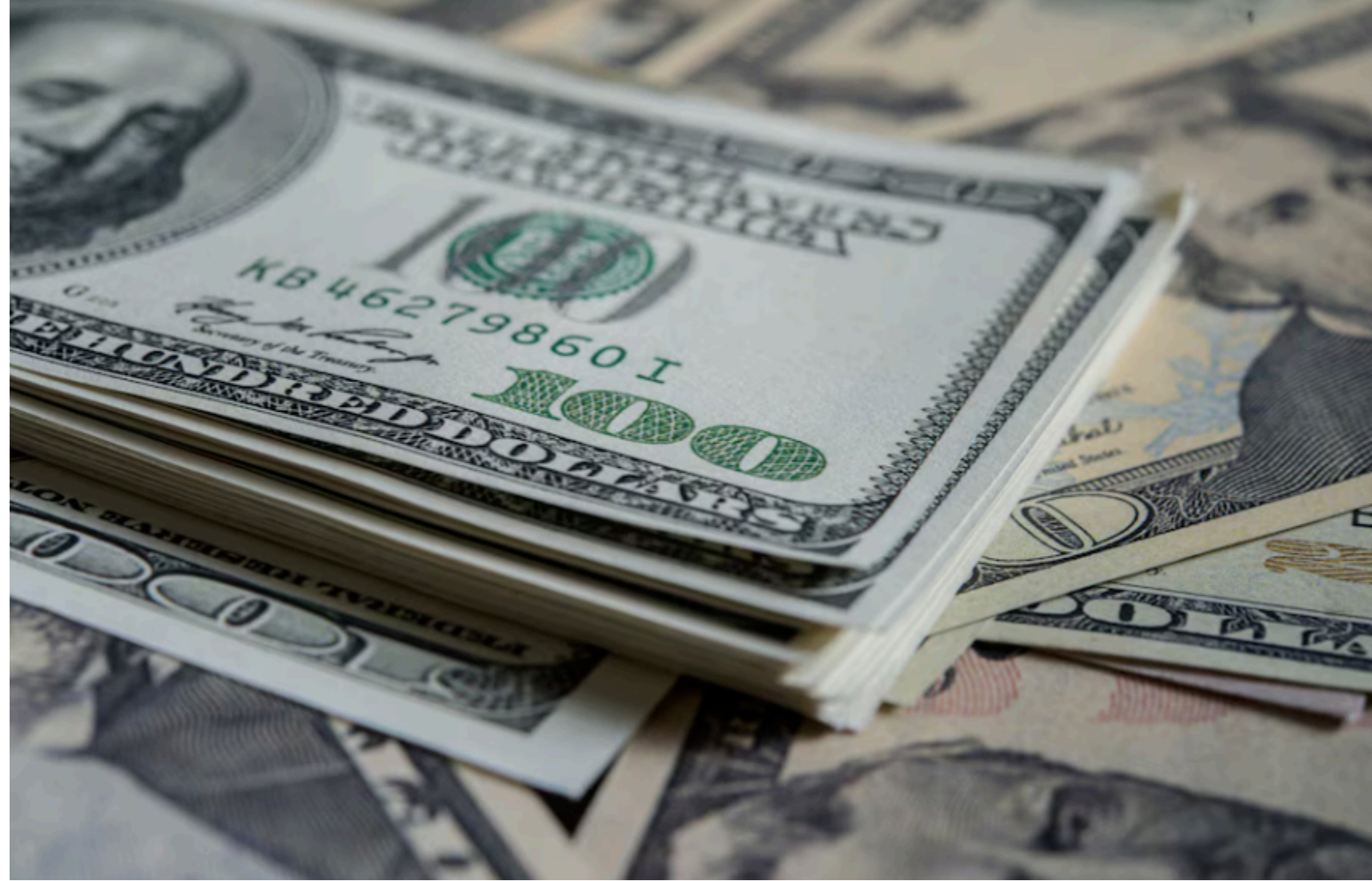
Податкові надходження від "Дія.City" зросли на 77% у 2026 році

За перші п'ять місяців 2026 року резиденти спеціального простору "Дія.City" сплатили до державного бюджету $23,7 мільярда податків. Цей показник на 77% перевищує результати за аналогічний період минулого року. Тоді компанії-резиденти перерахували до скарбниці $13,4 мільярда податків.