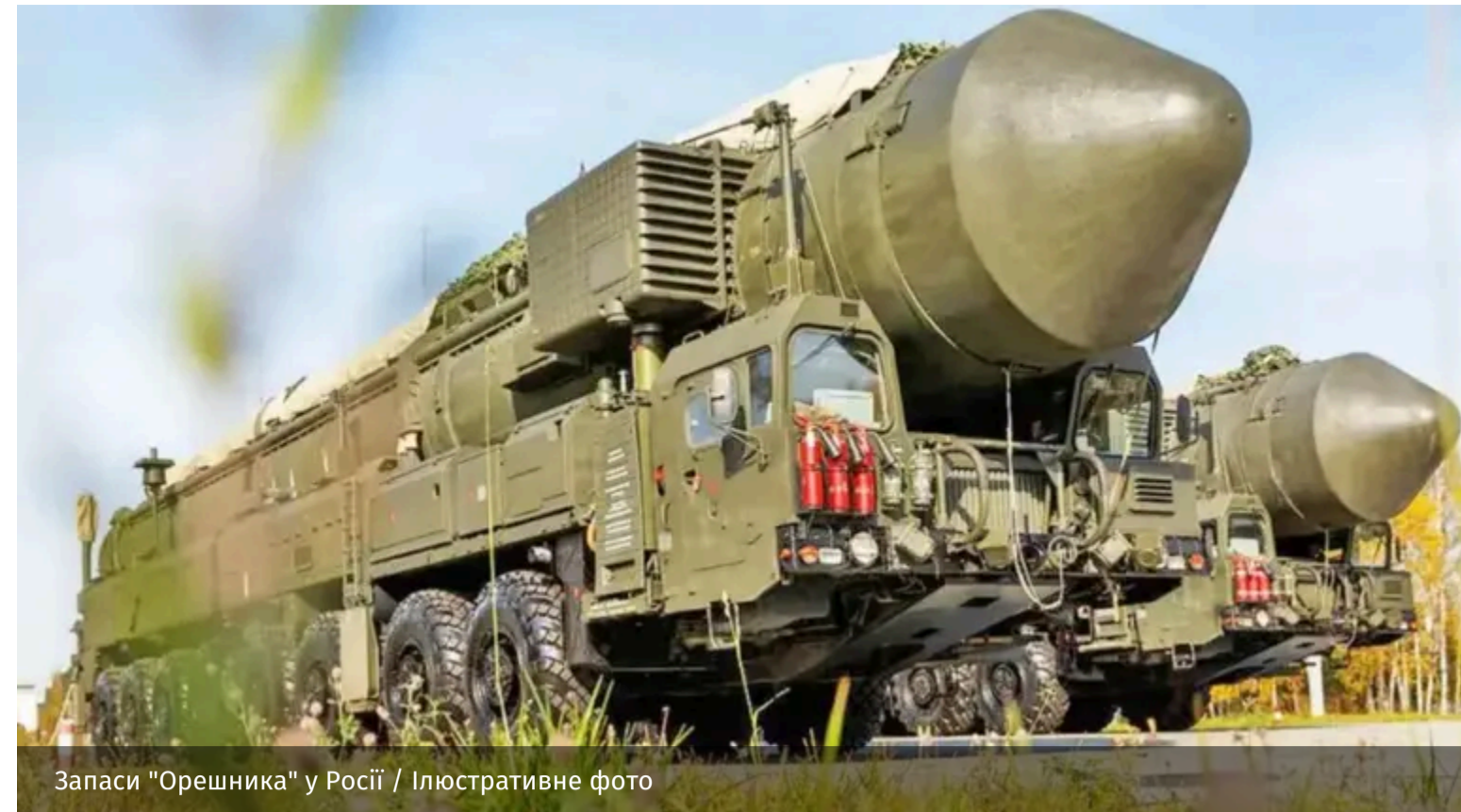
Запаси "Орешника" у Росії / Ілюстративне фото

Країна-агресорка не втрачала можливості похизуватися своїм озброєнням, якому нібито немає аналогів у світі. Такою зброєю, зокрема, стала балістична ракета середньої дальності "Орешник". Їх Путін запуслав по Україні вже декілька разів.