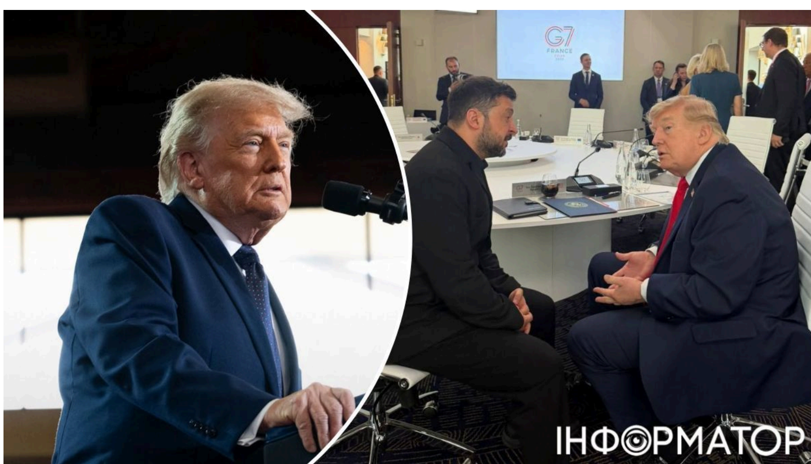
Трамп готовий посилити тиск на Росію після G7

На саміті G7 у французькому Евіані Дональд Трамп заявив про готовність відновити санкції проти російської нафти - і водночас дав зрозуміти, що будь-яка поступка Україні має свою ціну. Питання врегулювання війни знову опинилося в центрі порядку денного "Великої сімки" - після місяців, коли воно відходило на другий план через конфлікт на Близькому Сході. Зеленський заявив, що G7 одностайно підтримала Україну і підтвердила потребу в ракетах Patriot. Зустріч двох президентів тривала лише 75 хвилин.