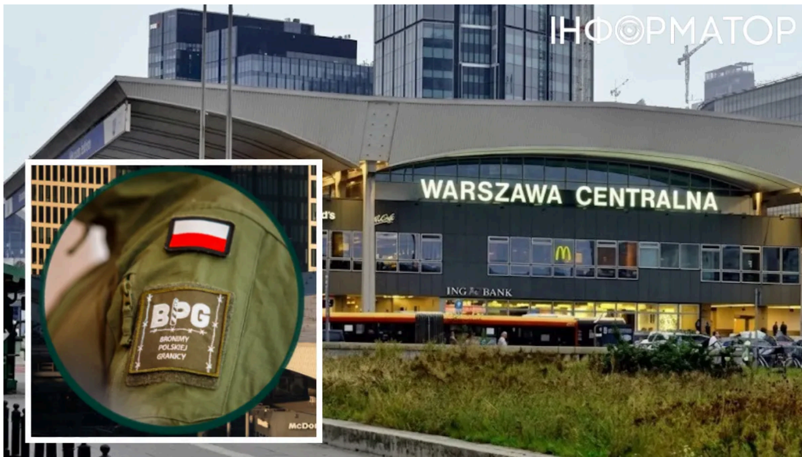
Ультраправі патрулюють вокзал Варшави - розслідування

На Центральному вокзалі Варшави з'явилися люди в однаковій формі, які зупиняють іноземних пасажирів (здебільшого темношкірих) і вимагають показати документи, хоча жодних повноважень для цього не мають. Напади на іноземців у Польщі більше не є поодинокими випадками - тепер агресія набула квазіформеної організаційної форми. Міністерство внутрішніх справ і адміністрації Польщі підтвердило: поліція веде розслідування, а матеріали передадуть до прокуратури.