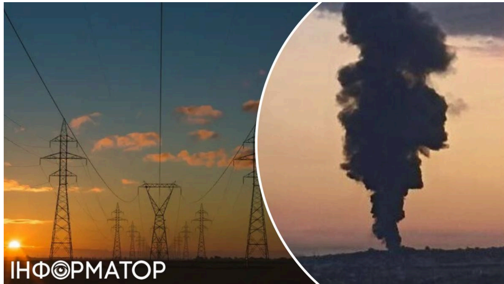
Вибухи на підстанціях вимкнули світло у Криму

На північному заході окупованого Криму вдень зникало електропостачання - мешканці Красноперекопська та Армянська повідомили про короткочасне вимкнення світла. Цього разу перебоїв стався після нічної атаки - вибухи в обох містах пролунали одразу після опівночі, а після них світло то зникало, то з'являлося знову. Удар, вірогідно, було завдано по одній або кількох електростанціях у регіоні.