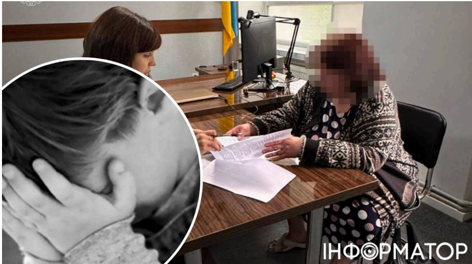
Від голоду помер хлопчик під соцсупроводом

Десятирічний хлопчик з інвалідністю помер від голоду у грудні 2025 року - попри те, що офіційно перебував під соціальним супроводом і мав захист з боку держави . Могилів-Подільська окружна прокуратура скерувала до суду обвинувальний акт щодо трьох осіб, відповідальних за нагляд над дитиною. За версією слідства, кожна з них не виконала своїх обов'язків, і це призвело до трагедії. Схожі випадки загибелі дітей через бездіяльність соціальних служб фіксують в Україні не вперше.