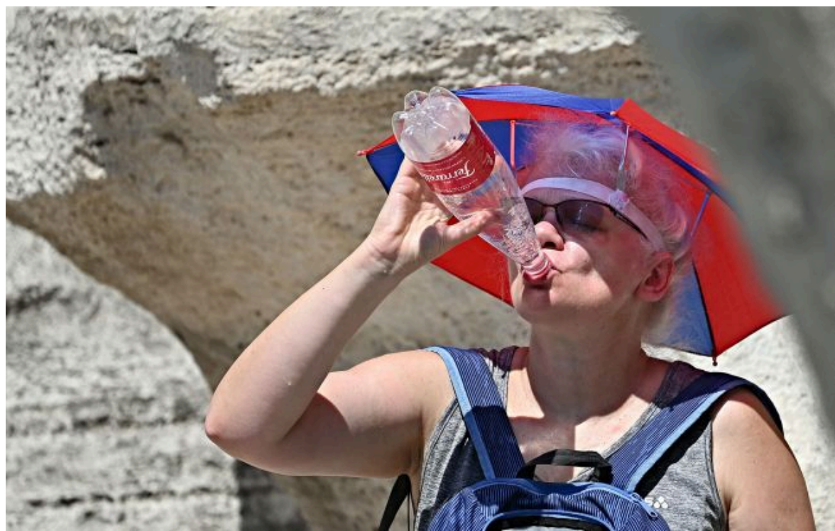
Європу накриє спека до 45 градусів