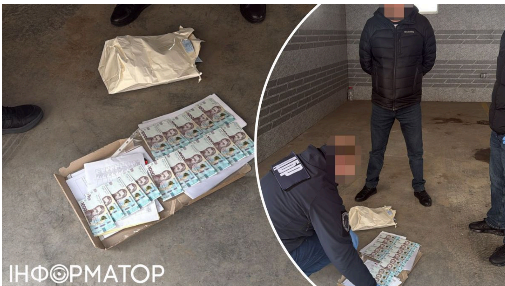
На Хмельниччині судитимуть начальника Держпраці

Працівники Державного бюро розслідувань затримали начальника управління Державної служби з питань праці у Хмельницькій області та приватну підприємцю за організацію схеми незаконної видачі дозвільних документів. Їх викрили спільно з СБУ - тепер обом фігурантам повідомлено про підозру й справа передається до суду. За час дії схеми посадовець отримав близько 60 тисяч гривень.