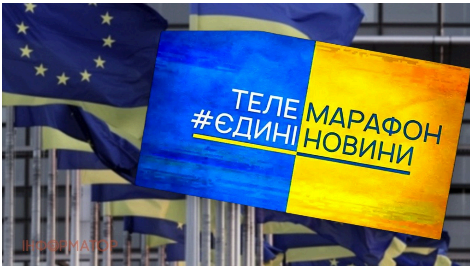
ЄС вимагає від України згорнути телемарафон

Євросоюз закликав Україну переглянути та поступово згорнути телемарафон "Єдині новини" і забезпечити повну незалежність медіарегулятора. Ця вимога з'явилася в контексті відкриття першого переговорного кластера між Україною та ЄС, який охоплює питання верховенства права, функціонування демократичних інституцій та інших базових критеріїв членства. Брюссель очікує швидкого впровадження реформ у медіасфері, щоб унеможливити повернення монополістичних і олігархічних структур. Без прогресу в цих питаннях подальший рух України до членства в ЄС буде ускладнений.