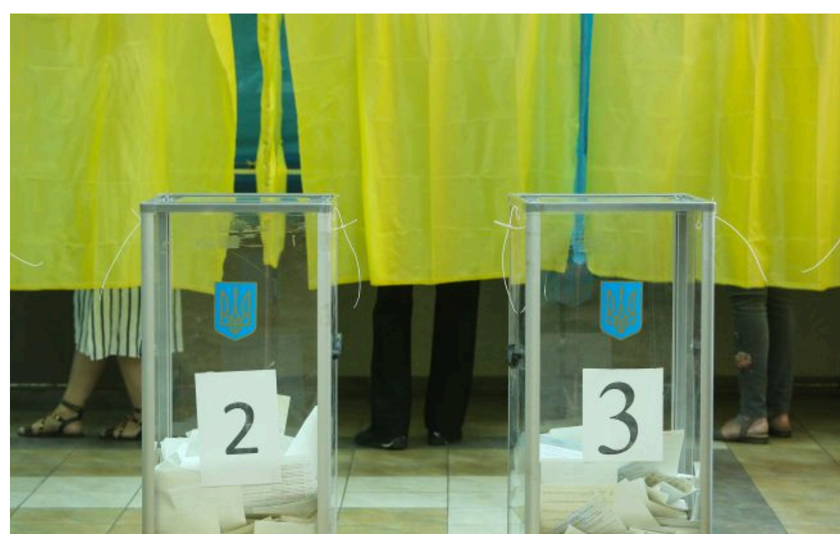
Фото ілюстративне: вибори в Україні