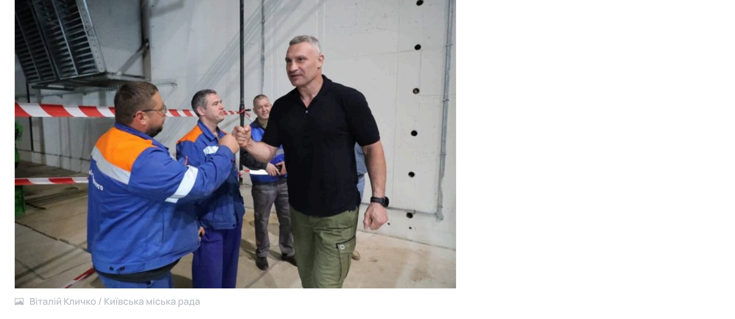
Віталій Кличко / Київська міська рада

Для стабільної роботи системи водопостачання місто змонтувало три дизель-генераторні установки. Їхня загальна потужність складає понад 15 МВт. У планах на цей рік – збільшити резерв потужності для систем водозабезпечення до 40 МВт.