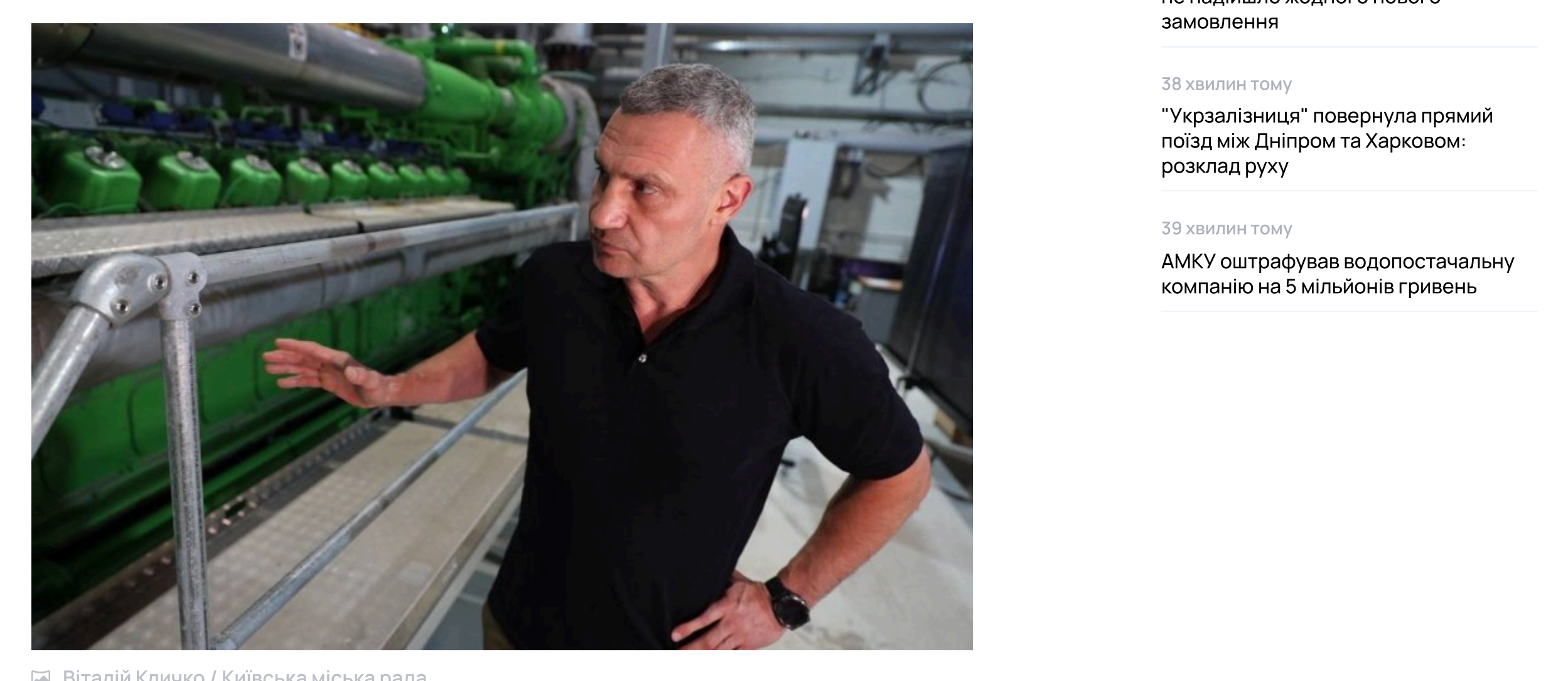
Віталій Кличко / Київська міська рада

Окрім запущених 60 МВт, ще понад 100 МВт потужності перебувають на стадії будівництва. Загалом до кінця поточного року Київ має отримати близько 200 МВт додаткової когенераційної потужності.ФОТО