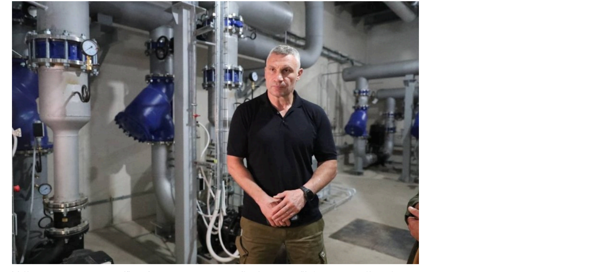
Кличко оглянув когенераційне обладнання на одному з об'єктів критичної інфраструктури Києва

Київ завершив будівництво нових об'єктів розподіленої когенерації, які мають потужність близько 60 МВт. Ці станції дозволяють одночасно виробляти електрику та тепло, забезпечуючи локальні мережі автономним живленням.