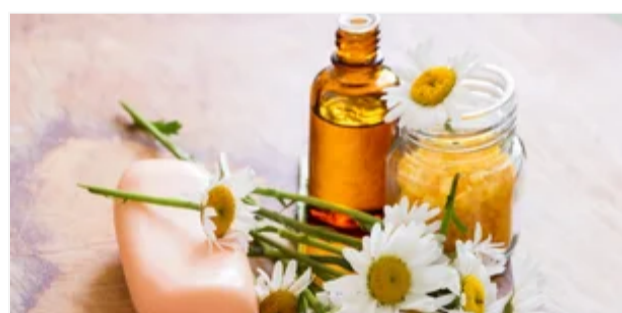
САМОЛІКУВАННЯ МОЖЕ БУТИ ШКОДИВИМ ДЛЯ ВАШОГО ЗДОРОВ'Я

Знищує паразити та виводить папіломи краще за будь-які препарати!