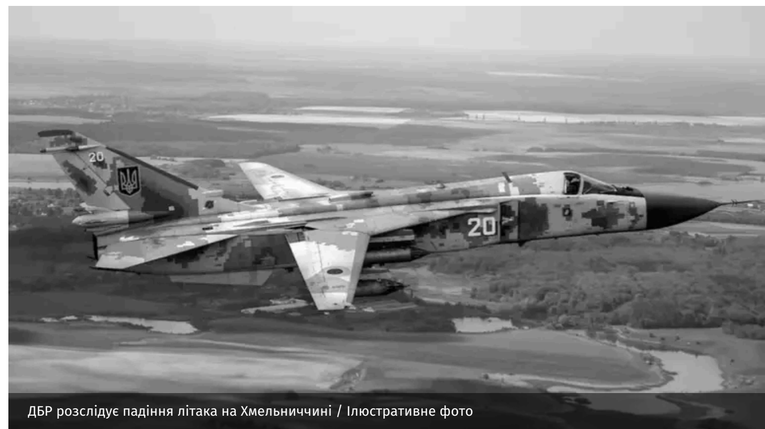
ДБР розслідує падіння літака на Хмельниччині / Ілюстративне фото

ДБР розслідує обставини авіакатастрофи літака Су-24М у Хмельницькій області. В її результаті загинули двоє військовослужбовців.