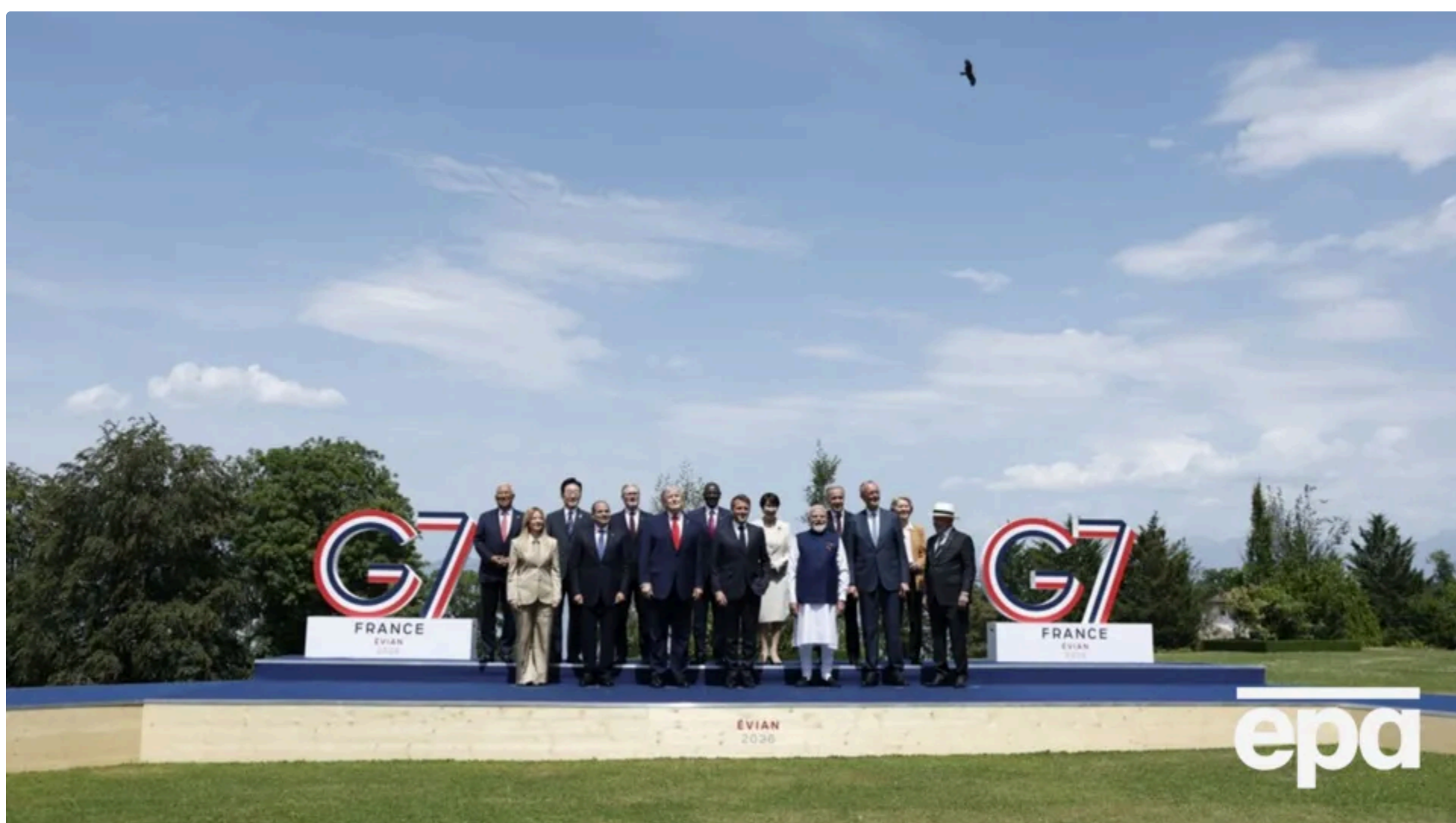
У заяві G7 фіксує продовження політики довгострокової підтримки України й одночасне посилення тиску на РФ

17 червня, 09:33 🗨️ Этот материал также можно прочитать на русском