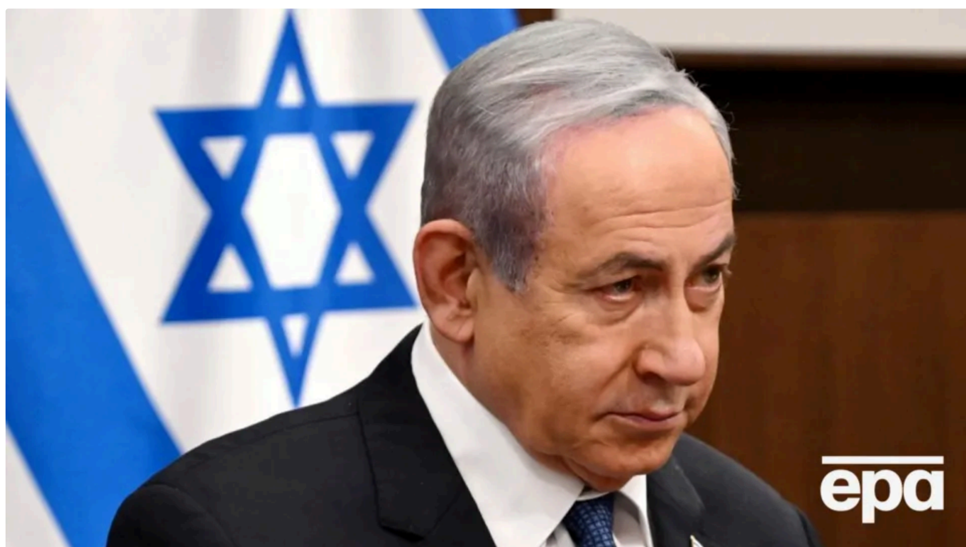
Ізраїль звертався із проханням ознайомитися з текстом угоди до її підписання, стверджують джерела

США відмовилися надати Ізраїлю попередній доступ до нового меморандуму про взаєморозуміння з Іраном перед офіційною церемонією підписання, яка, за попередніми даними, має відбутися у Швейцарії наприкінці тижня. Про це 16 червня повідомила The Jerusalem Post із посиланням на джерела.