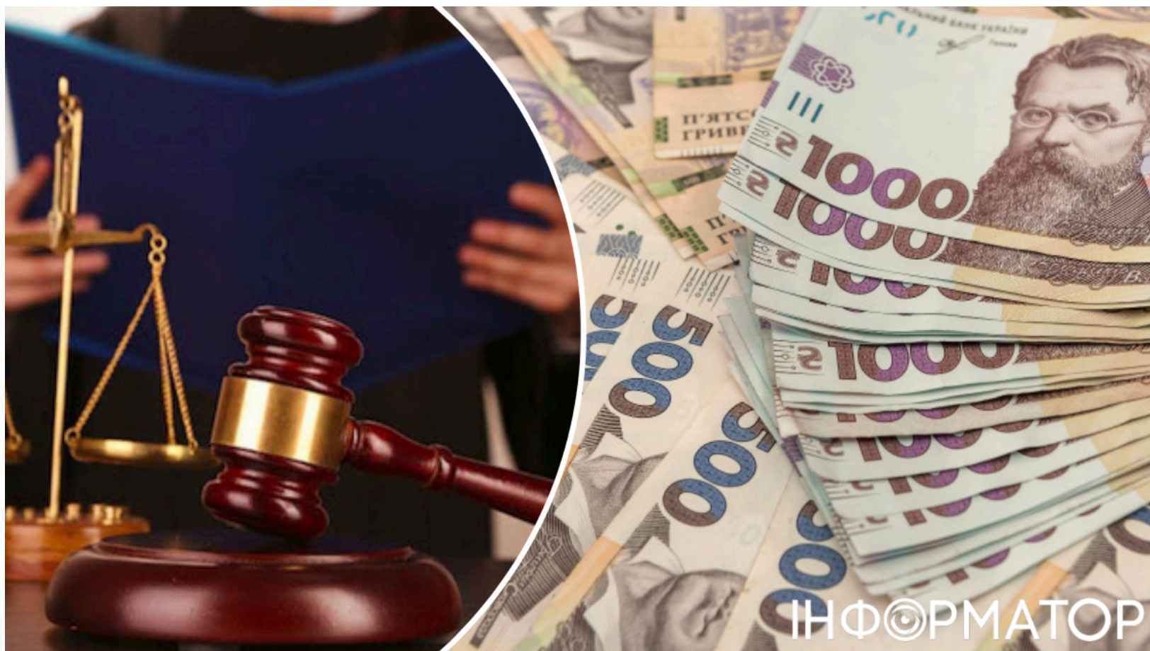
Прокурор з Чернігівщини уникнув тюрми за хабар

Прокурор з Корюківської окружної прокуратури Чернігівської області вимагав хабар у посадовця міської ради і врешті-решт отримав умовний строк замість реального ув'язнення. Схожий механізм - умовний вирок в обмін на донат армії - суди вже застосовували раніше: ВКС ухвалив аналогічне рішення у справі спілника ексголови Верховного Суду. Справу про хабарництво чернігівського прокурора розглядав Деснянський районний суд міста Чернігова 11 червня цього року. Суд затвердив угоду про визнання винуватості й звільнив обвинуваченого від відбування покарання з іспитовим строком.