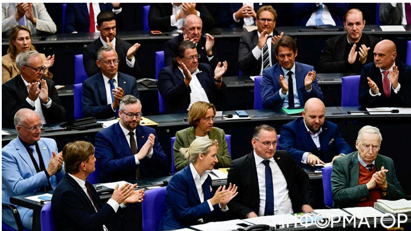
Партія АдН побила рекорд рейтингу у Німеччині

Ультраправа "Альтернатива для Німеччини" встановила рекорд підтримки в соціологічних опитуваннях - партія, яка відкрито виступає проти допомоги Україні й закликає відновити торгівлю з Росією, вперше обійшла правлячий блок із настільки великим відривом. За результатами дослідження інституту YouGov, "АдН" випереджає коаліцію ХДС/ХСС на рекордні 9 відсоткових пунктів.