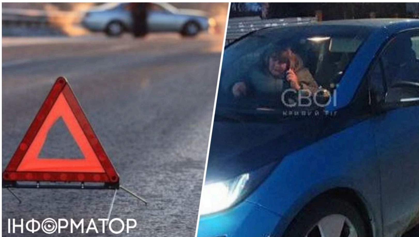
Суддя збила дитину у Кривому Розі: хлопчик помер

У Кривому Розі помер 12-річний хлопчик, якого ще у лютому на пішохідному переході збила суддя. Чотири місяці медики боролися за його життя, проте врятувати дитину не вдалося. Справу вже передано до суду, однак підозрюваній обрали найм'якший можливий запобіжний захід.