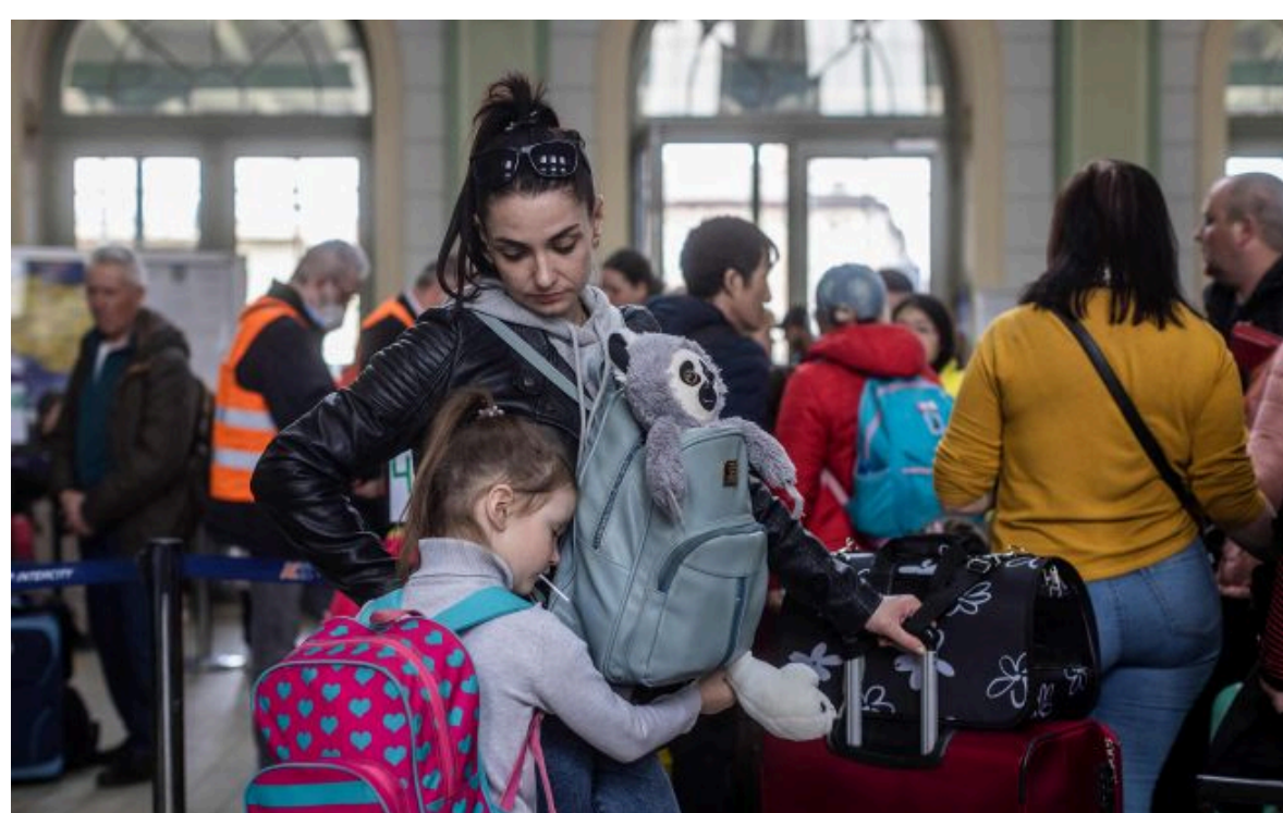
Фото: Єврокомісія готує пропозицію щодо захисту українців з березня 2027 року