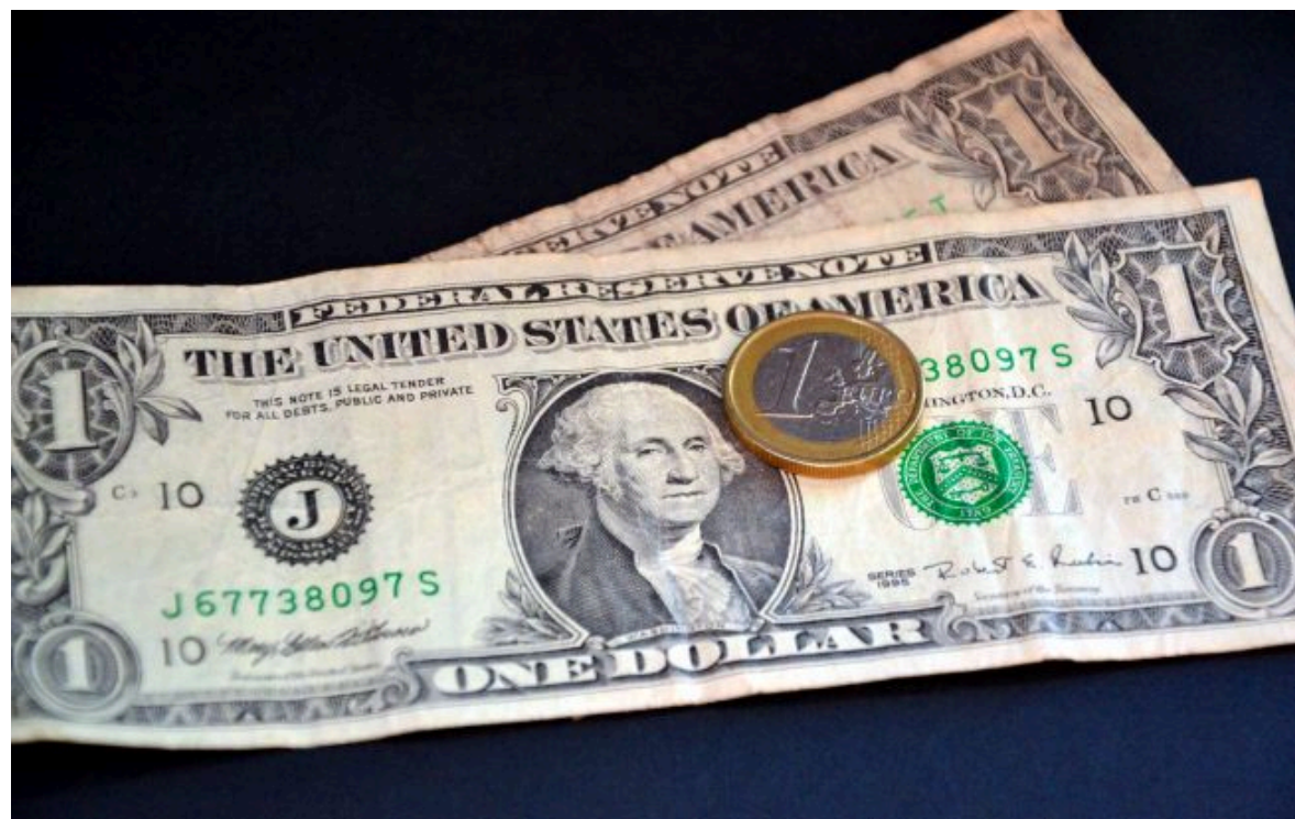
Фото: США спрямують понад мільярд доларів на допомогу ЮНІСЕФ та ВПП у світі