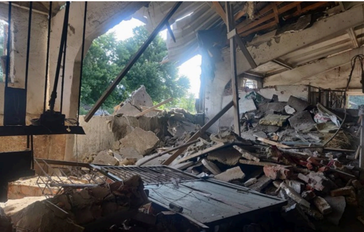
Кінно-спортивна школа на Сумщині стала об'єктом агресії росіян

За попередньою інформацією, працівники закладу не постраждали. Удар припав по стайні.