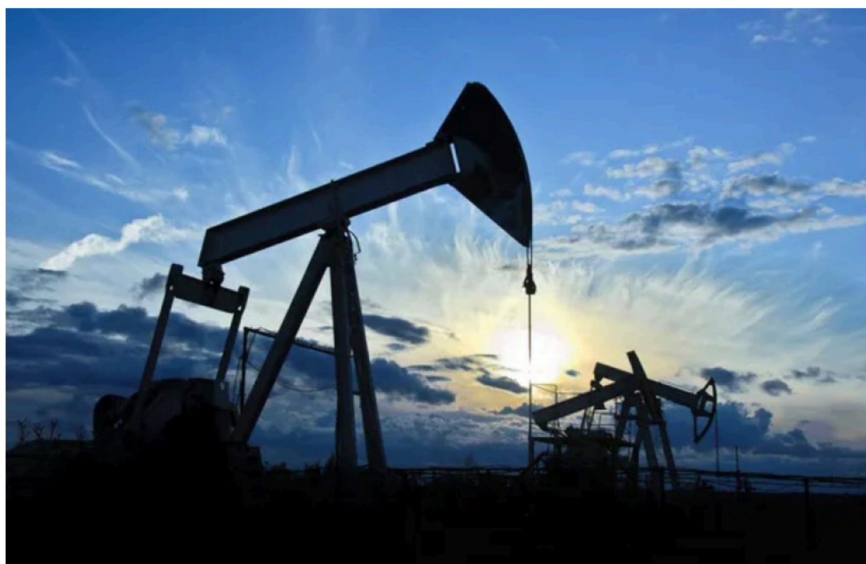
Ціна на нафту падає

Станом на 17 червня 2026 року ціна нафти Brent становить $78,99 за барель, WTI – $76,11, а Urals – $67,80. Нафта продовжує падати, продовживши тренд попередньої торгової сесії. Причиною падіння ринку стало укладення тимчасової мирної угоди між США та Іраном.