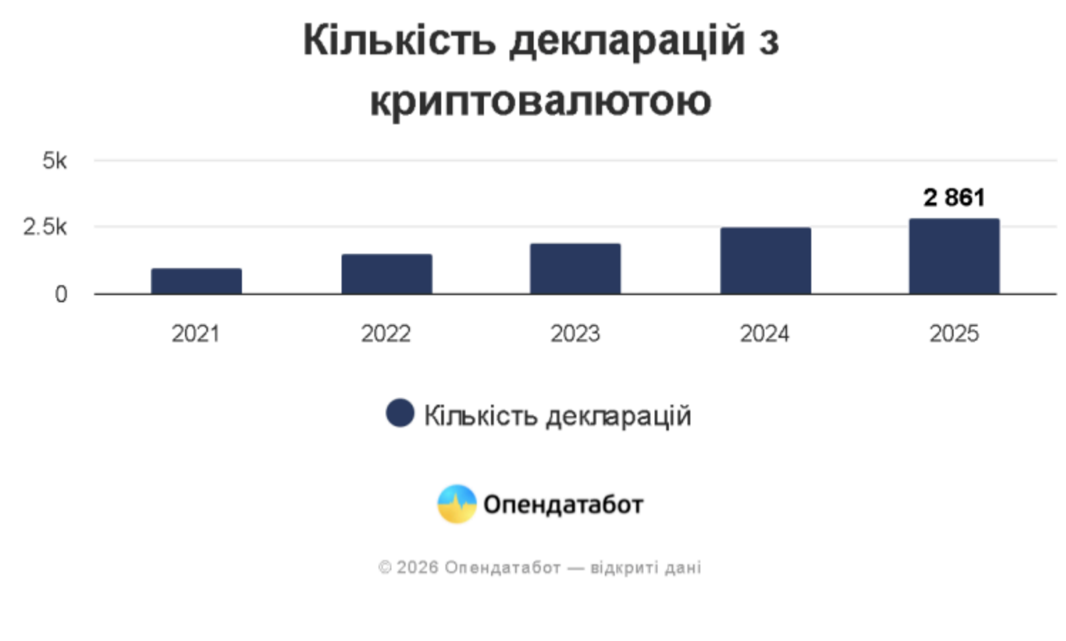
© 2026 Опендатабот — відкриті дані

Про це повідомляє Delo.ua з посиланням на дані "Опендатабот".