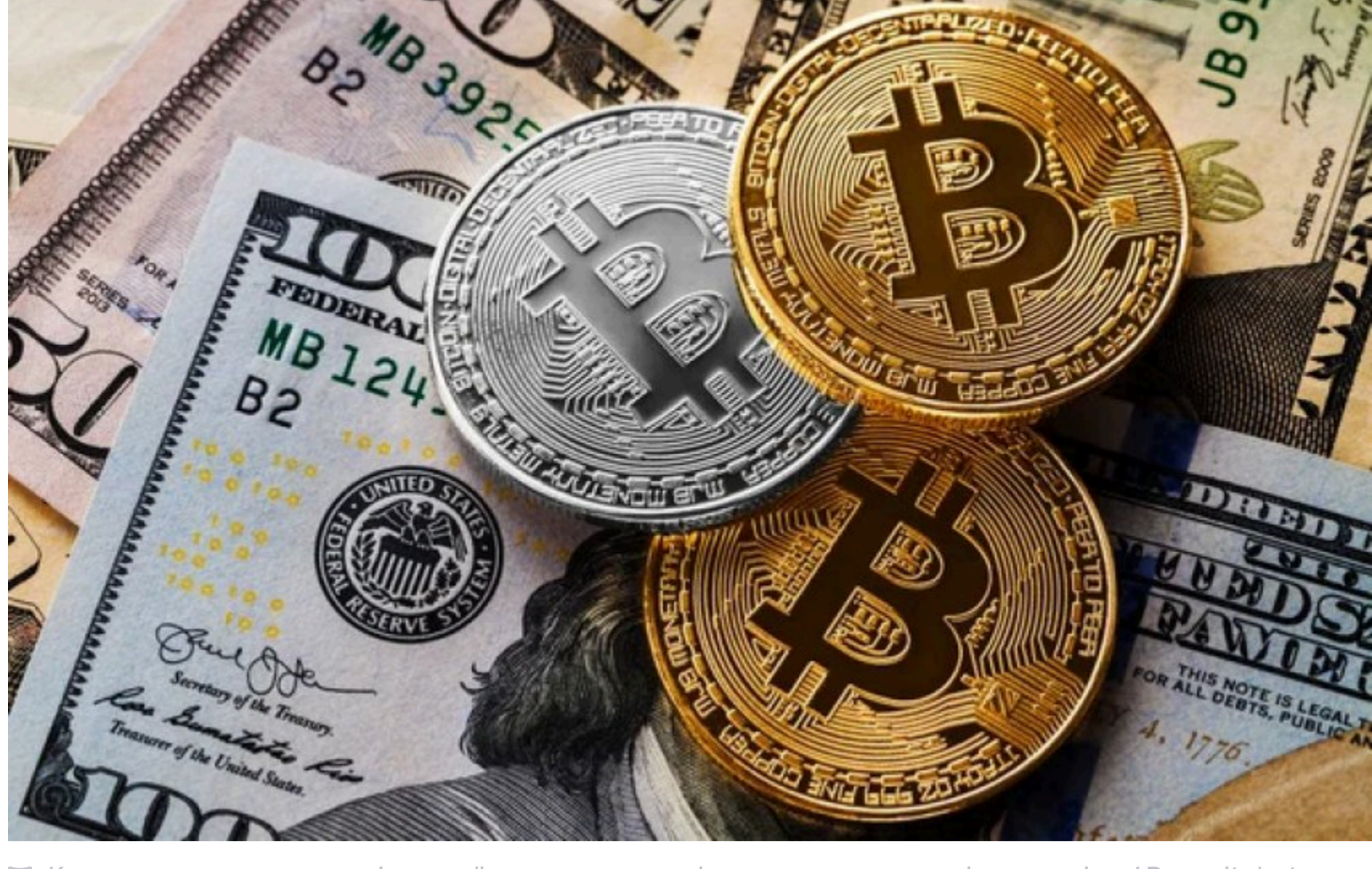
Криптовалюта в деклараціях українських посадовців почувається дедалі впевненіше

2 861 декларацію з криптоактивами подали посадовці за 2025 рік, що на 16% більше, ніж роком раніше. Найчастіше крипту декларують поліціанти, прокурори та військові. 278,8 млн грн лише у біткойнах задекларував депутат-рекордсмен.