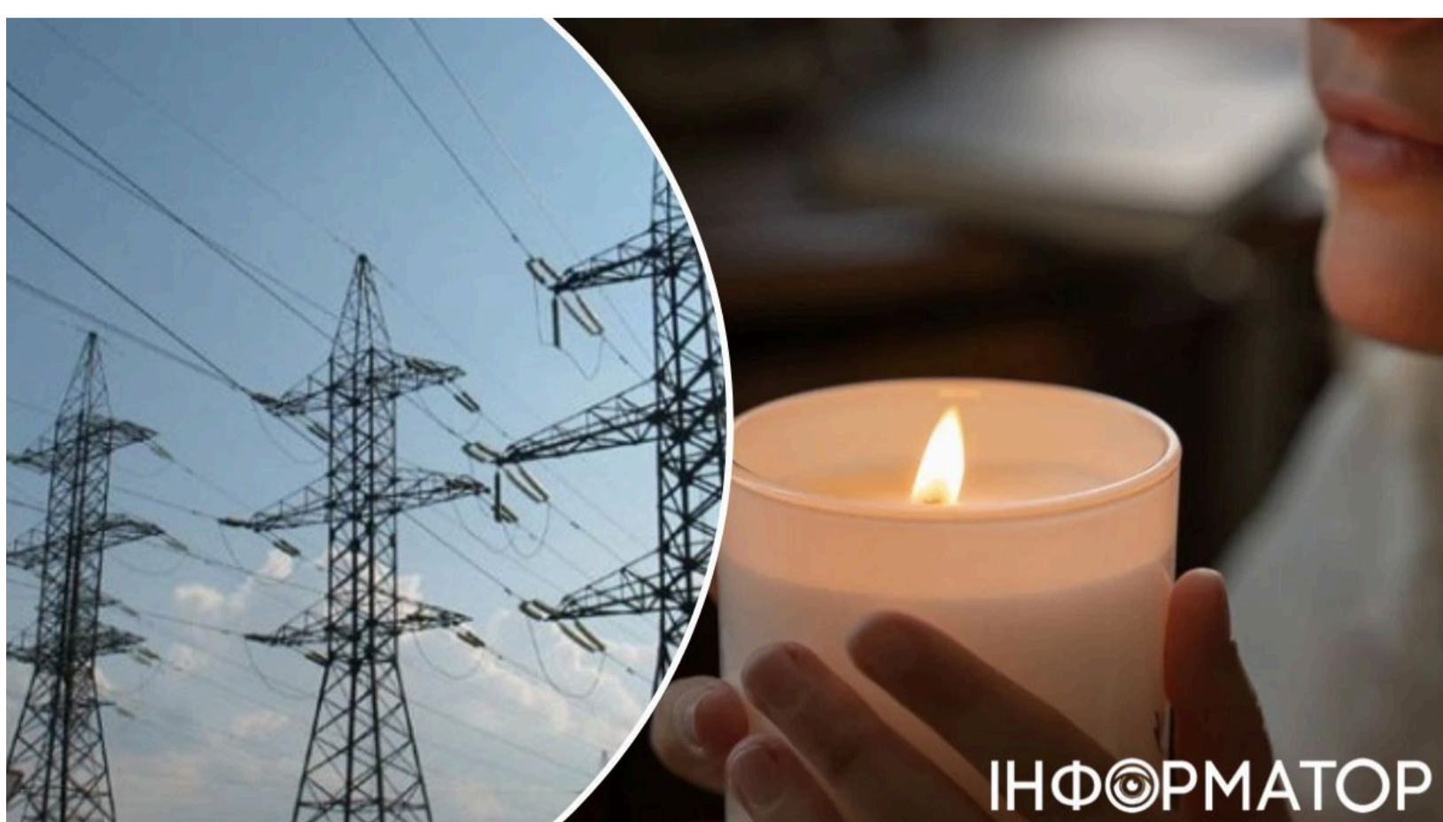
Відключення світла влітку – три сценарії для України

Масових графіків відключень влітку в Україні автоматично не буде, однак ситуація може змінитися в будь-який момент. Усе залежить від двох ключових чинників - погоди та нових ударів Росії по енергетиці. Аналітичний центр DiXi Group розрахував три сценарії проходження літнього енергетичного сезону: від помірного дефіциту до кризового, за якого дефіцит у пікові години може сягнути 6,2 ГВт.