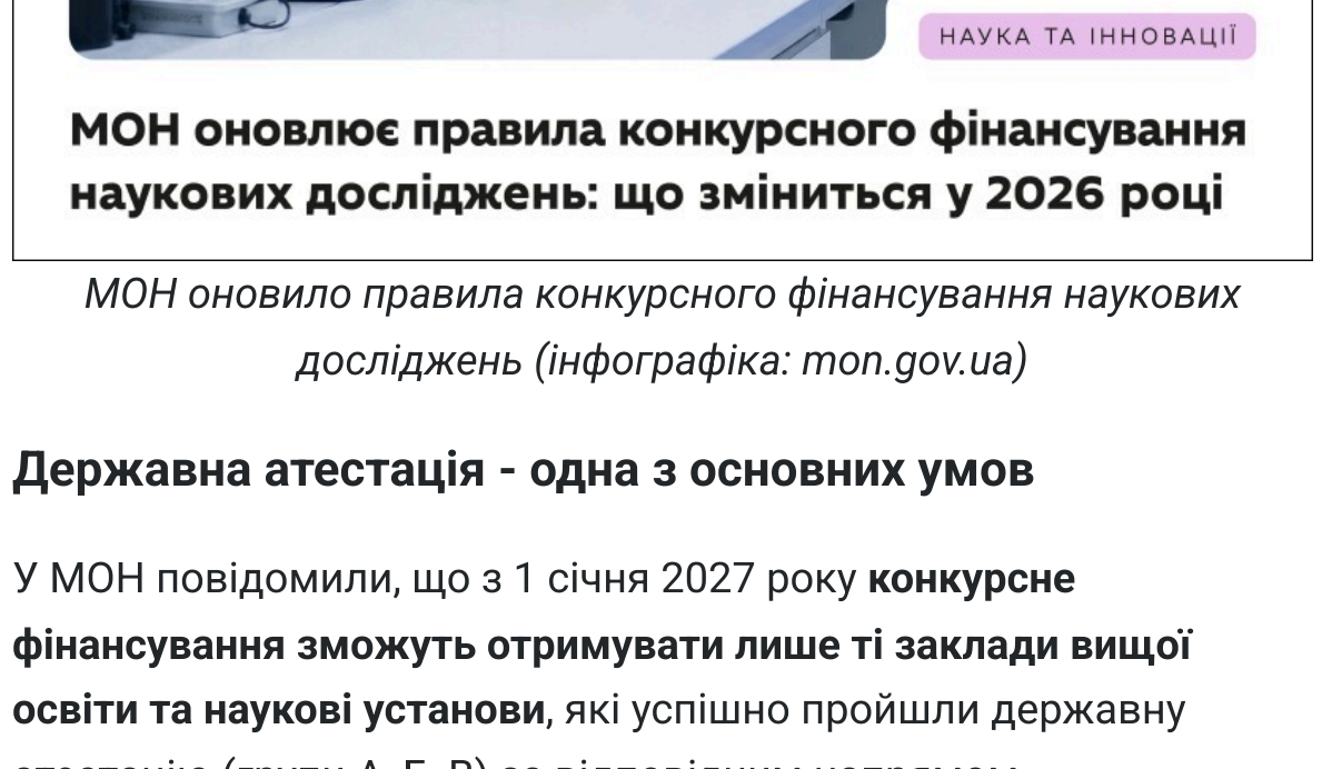
МОН оновило правила конкурсного фінансування наукових досліджень

Він зауважив також, що "важливо підтримати молодих вчених і ті наукові колективи, які продовжують працювати в прифронтових регіонах попри складні безпекові умови".