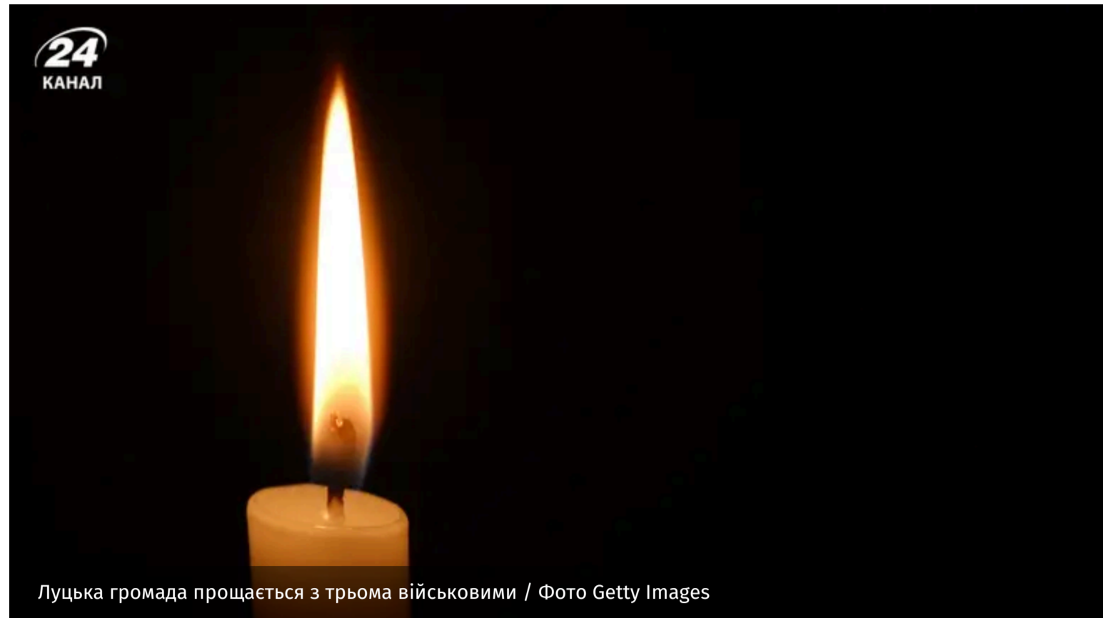
Луцька громада прощається з трьома військовими

Україна знову втратила захисників. На фронті загинули Іщук Олександр, Снопко Руслан і Лавренчук Дмитро.