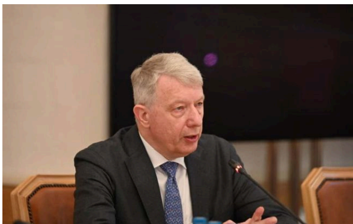
Фото: євродепутат з Люксембургу Фернанд Картейзер (facebook.com/FernandKartheiser)