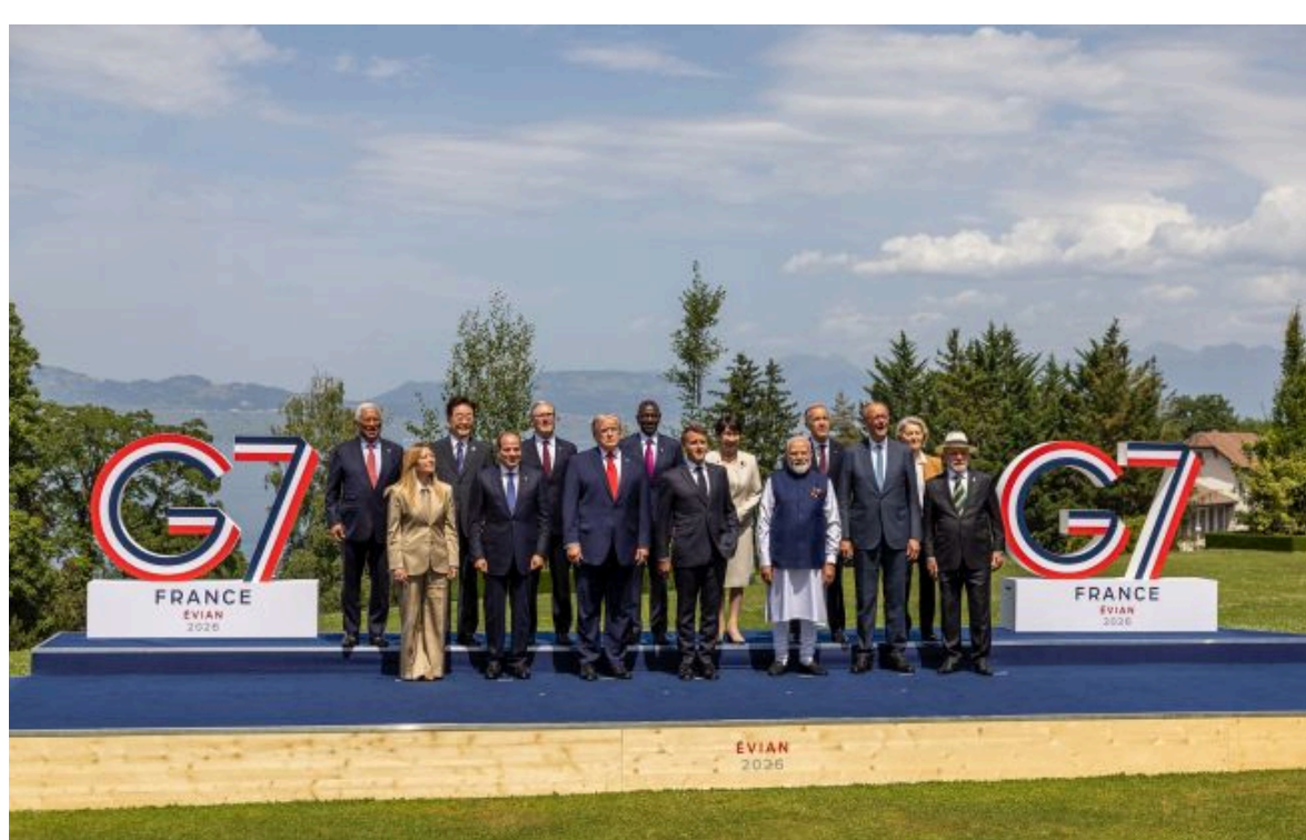
Фото: лідери країн "Великої сімки" на саміті блоку у Франції