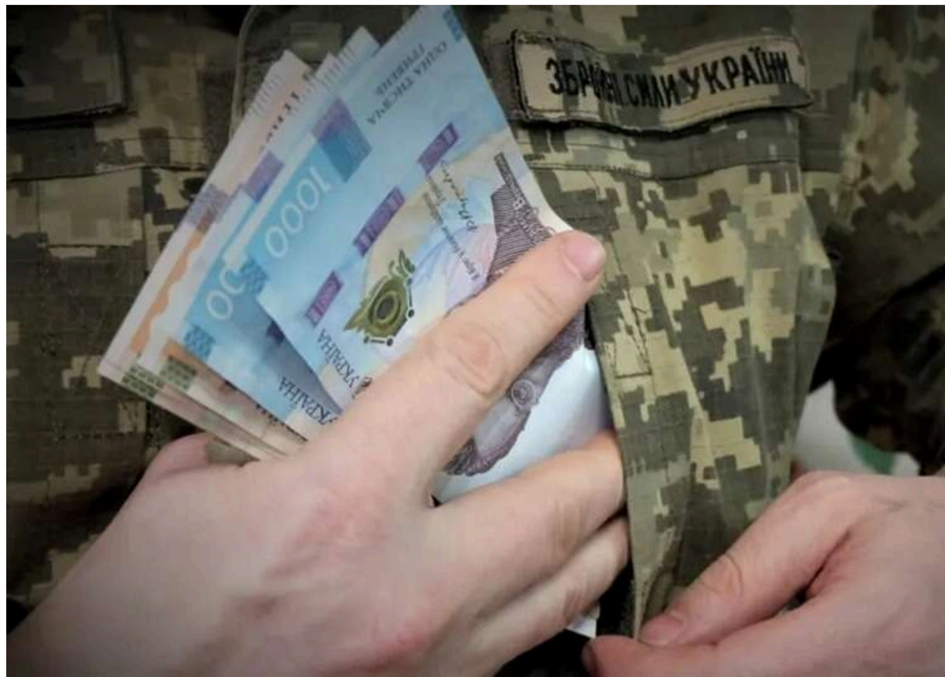
«Це ваша внутрішня проблема»: партнери відмовилися фінансувати грошове забезпечення ЗСУ з кредиту на 90 мільярдів євро

Читати на руськом Read in English Додати як бажане джерело в Google