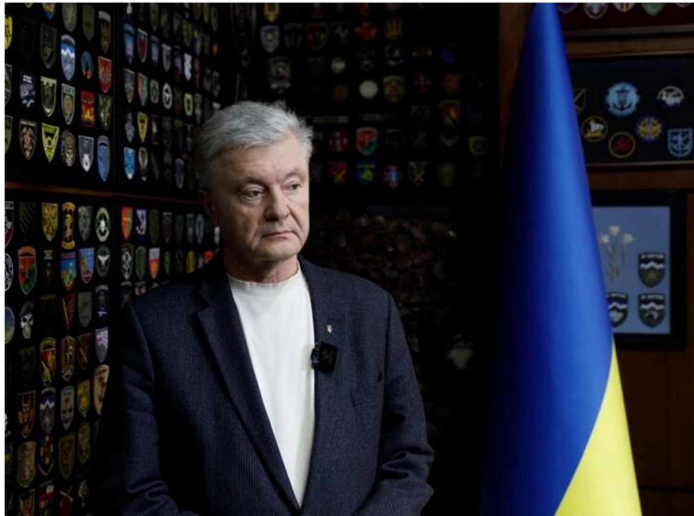
Порошенко засвітив піджак за понад 120 тисяч гривень

Петро Порошенко з'явився на публіці в піджаку бренду Tom Ford.