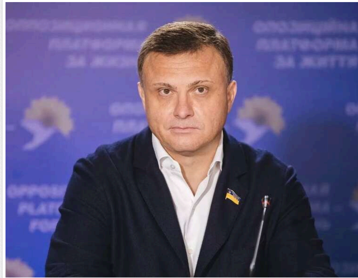
ОАСК дозволив Львовчкіну та його партнеру збудувати 23-поверховий хмарочос біля Києво-Печерської Лаври

Читати на руском Read in English Додати як бажане джерело в Google