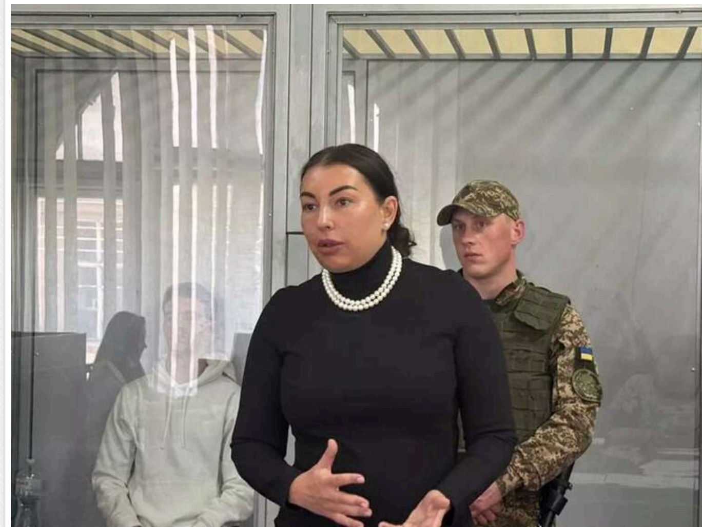
"Рішення було незаконним": адвокатці підозрюваного у вбивстві Фаріон поновили право на діяльність